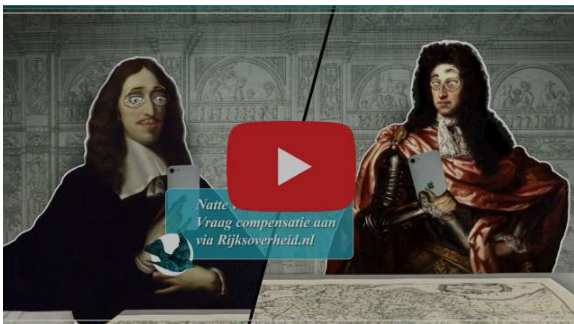
Reconstructie van de Oude Hollandse Waterlinie